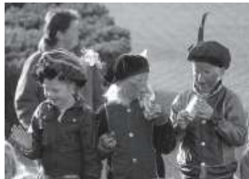
Verlegen zwaait het meisje naar Sinterklaas vanaf een muurtje

Let op: Op de site zijn drie foto's van kinderen geplaatst die bij de aankomst aanwezig waren. Zij kunnen bij Patrick's kaasboetiek een leuke attentie afhalen.