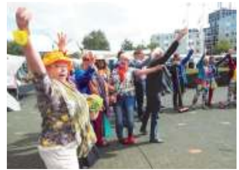
De Hengelose Operettevereniging HOOV zorgde voor een spetterend flashmob-optreden.

weldra stroomde het plein vol met publiek dat de rest van de middag genoot van het kunstaanbod, de muziek en de zon. Eén