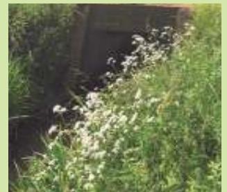
Op de foto ziet u bloeiende valeriana bij het industrieterrein langs de Oldenzaalstraat.

Bij de tweede maaibeurt, globaal van 15 september tot 15 oktober, zullen waarschijnlijk wel alle zijkanten van de beek worden gemaaid. Omdat er in de herfst en winter vaak erg veel water door de smalle beken moet stromen, is de doorstroming (dus minder planten) erg belangrijk om de wijk droog te houden.