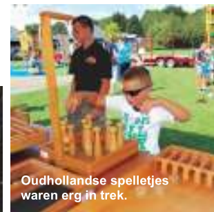
Oudhollandse spelletjes waren erg in trek.

Aan het slot van de dag ontstond spontaan een geheel nieuwe attractie, namelijk een groot zwembad. Nadat de raderbootjes uit het