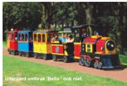
Uiteraard ontbrak 'Bello' ook niet

Wijkagent Marc Roelofsen kwam spontaan op de Wijkdag met een stand voor het serieuze werk, zoals informatie geven over inbraakpreventie wat gezien het aantal inbraken de laatste tijd in de wijk wel erg gewenst was. De 'inbrekersgereedschappen' op tafel waren bedoeld tegen wegwaaien van de folders.