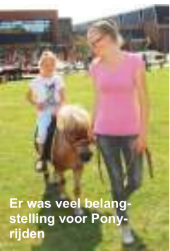
Er was veel belangstelling voor Ponyrijden

De Activiteitencommissie, de Wijkraad Hasseler Es en alle aanwezige wijkbewoners kunnen terugzien op de meest succesvolle Wijkdag van jaren. Dit was mede te danken aan de zon die de hele dag volop bleef schijnen.