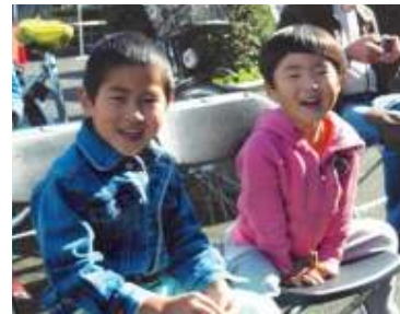
Deze twee kinderen genoten van de muziek door Franks groep.

van de kunstenaars merkte na afloop op: "Zelfs de kunsten hebben inmiddels last van klimaatverandering."