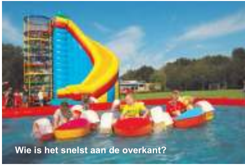
Wie is het snelst aan de overkant?

Een zonnige dag maakte de Wijkdag 2015 van 22 augustus tot een geweldig succes met een spetterend afsluiting.