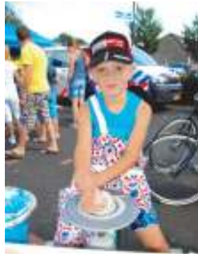
Pottenbakken is best lastig.

de Vietnamese loempia's, de poffertjes en de heerlijke gerookte zalmforellen. Bij de kinderattracties stonden lange rijen. De kinderen waren niet weg te slaan bij de klappers van die dag, de raderbootjes, de klim- en glijtoren en het stoomtreintje dat nog laat in de middag overuren draaide rond de vijver in de wijk. 's Middags konden de kinderen op een paard klimmen en een rondje rijden over het gazon. Ook oudhollandse spelen, zoals sjoelen, waren erg in trek. Bij het kleien werden door de kinderen wel honderd werkstukken gemaakt.