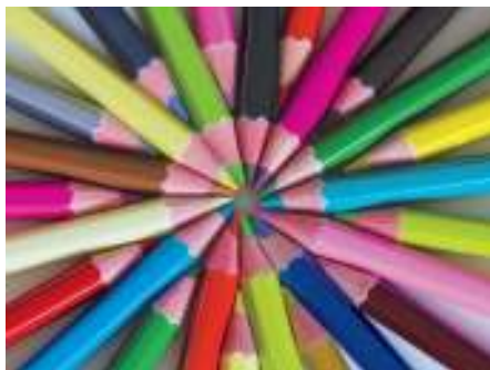
Kleurencirkel' Frank Ebbekink.