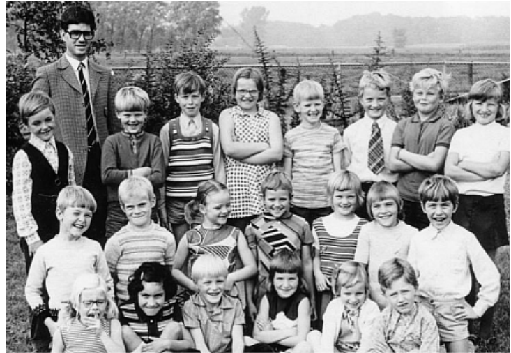
Klassenfoto uit 1972 van combi-groep 2/3 Wie herkent zich?? Grote foto bij de redactie.

Maar generaties Hasseloers zullen nog verhalen kunnen vertellen over juffrouw Sogtoen.