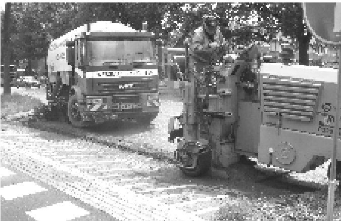
Met kloppen, vegen en zuigen wordt de Westelijke Esweg geschild