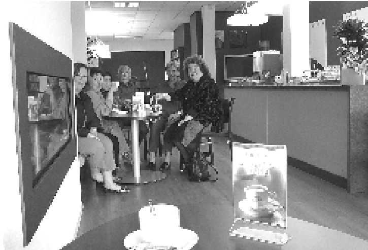
Gezelligheid kent geen tijd. Altijd klaar voor een praatje....

Iedereen die al eens in het Kulturhus is geweest is er al langsgelopen, of heeft er wellicht al een kopje koffie gedronken: de ontmoetingsruimte.