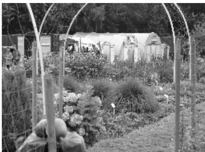
blik op kassen, grassen, bloemen en pompoenen

In diverse versierde stalletjes gaven de medewerkers uitleg en werden planten, bloemen, groenten en vruchten verkocht. In de kassen konden tomaten, komkommers, paprika's, pepers, zinnia's en rozen worden bekeken terwijl op de velden van het 1,5 hectare grote terrein een enorme verscheidenheid aan gewassen viel te bewonderen. Maar ook aan de kinderen was gedacht, want in een grote open tent konden ze een schminkbeurt ondergaan. In diezelfde tent werden hapjes aangeboden, die gemaakt waren met producten van eigen teelt. Ook hier was aardig wat belangstelling en men liet het zich goed smaken. Dankzij het toch nog redelijke weer werd het een geslaagde dag met veel interesse voor dit unieke project in Hengelo.