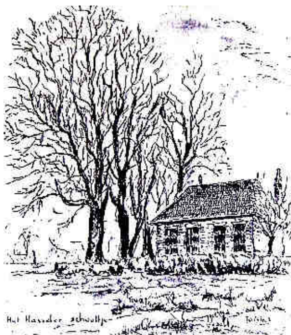
Het Hasseler schooltje

Deze artikelen verschijnen onder copyright van Jo Niks