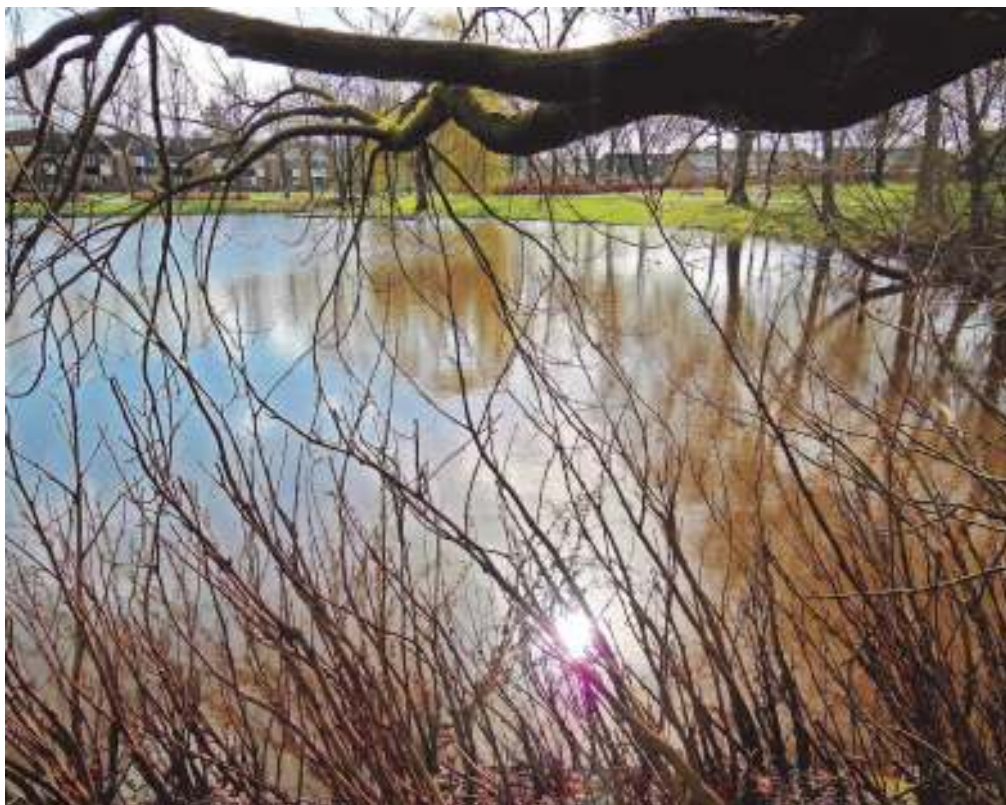
De nog lover- en lommerloze Buziauvijver in een (a)pril zonnetje.

Het water van de Buziauvijver kleurt momenteel een tijdje wit. Dit is het gevolg van een proef van het Waterschap Vechtstromen, waarbij coccolietenkrijt in het water werd gestrooid. Dit speciale krijt, afkomstig van kalkschilden van eencellige algen, moet ervoor zorgen dat er in de toekomst minder onderhoud nodig is om de dikte van de sliblaag in het water binnen de perken te houden. Dit kan veel geld besparen. Op initiatief van de wijkraad is het punt van het onderhoud en de waterkwaliteit van de Hesbeek en de vijvers sinds vorig jaar onderwerp van gesprek tussen het Waterschap, gemeente, visvereniging en de Wijkraad Hasseler Es.