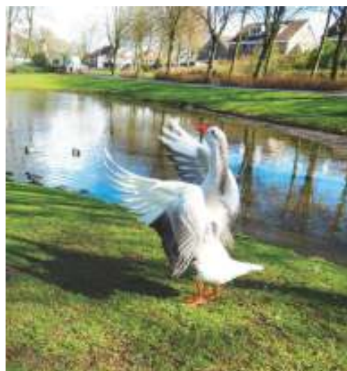
Deze gans bij de Buziauvijver uit zijn lentegevoel met een rondedansje.

Slaagt de proef dan kan het kostbare en overlast veroorzakende uitbaggeren van de vijvers voorlopig achterwege blijven.