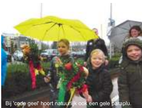
Bij 'code geel' hoort natuurlijk ook een gele paraplu.

De KNMI gaf weeralarm 'code geel' af voor Palmpasen op zondag 29 maart. Stortregens en windvlagen werden beloofd tijdens de palmpasenoftocht vanuit de Thaborkerk. Maar net na afloop van de Palmpasenviering hielden de weergoden zich gelukkig even koest en viel er tijdelijk slechts een mild maarts regentje. De drumband maakte eerst een rondje door de kerk en nam vervolgens de pastor met de grote palmpaasstok en de bezoekers met hun palmpaasstokjes mee naar buiten. Na een korte wandeling door de wijk werd de grote palmpaasstok met paasbroden en ander lekkers afgeleverd bij een woongemeenschap met geestelijk gehandicapten. Eenmaal terug bij de kerk begon het opnieuw te gieten. Soms moet je geluk hebben. De foto's van de geslaagde optocht zijn op de website www.wijkwegwijs.nl/thabor/palmpasen2015 te zien.