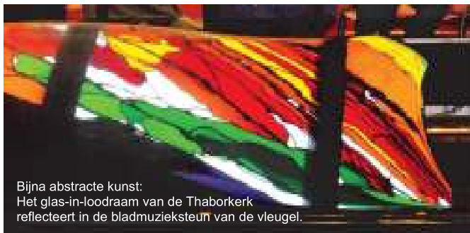
Bijna abstracte kunst: Het glas-in-loodraam van de Thaborkerk reflecteert in de bladmuzieksteun van de vleugel.