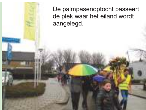
De palmpasenoftocht passeert de plek waar het eiland wordt aangelegd.

Op de inspraakavond met belanghebbenden en de gemeente in het kulturhus is overeenstemming bereikt over de plek voor het ondergrondse milieueiland bij het winkelcentrum. Het komt op de hoek Hans Vonkstraat en Willem van Otterloostraat op de plek van de vlaggenmasten.