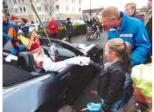
Sinterklaas arriveert in de zwarte sportwagen

op het podium komen en daar alsnog solo een lied zingen voor Sinterklaas, hetgeen zij voortreffelijk deed. Na een korte toespraak en een laatste lied wilde Sinterklaas het publiek niet langer op de proef stellen en maakte vervolgens een wandeling naar het winkelcentrum. Op weg erheen kwam Sint handen