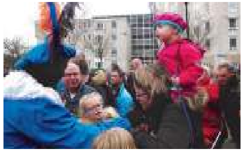
Piet voorziet een moeder van lekkers.

greep in de juten zak altijd wel iets lekkers. Als bijen in een veld bloemen met overvloedig nectar renden de kinderen van piet naar piet. Na zijn ronde door het winkelcentrum keerde de sint weer terug naar het kulturhus. Daar begon om vier uur een groot feest ter ere van Sinterklaas en de pieten. Op de achterpagina staat een kort verslag met foto's van dit feest. Alle foto's staan op de website www.wijkraadhasseleres.nl