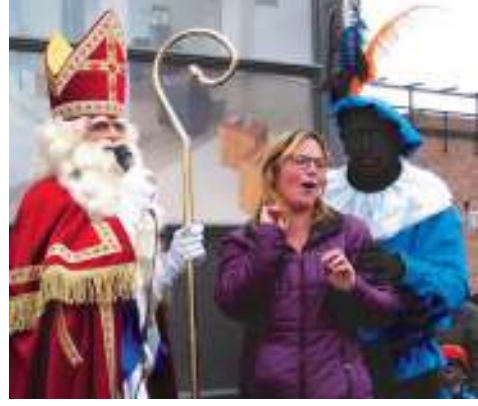
Een sportieve zingende moeder op het podium

greep in de juten zak altijd wel iets lekkers. Als bijen in een veld bloemen met overvloedig nectar renden de kinderen van piet naar piet. Na zijn ronde door het winkelcentrum keerde de sint weer terug naar het kulturhus. Daar begon om vier uur een groot feest ter ere van Sinterklaas en de pieten. Op de achterpagina staat een kort verslag met foto's van dit feest. Alle foto's staan op de website www.wijkraadhasseleres.nl