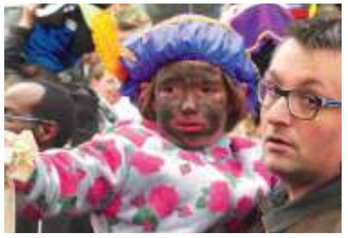
Niet alle kinderen verkeerden in jubelstemming. Best een beetje eng allemaal.

tekort om alle aanwezige kinderen stevig de knuistjes te drukken. Knappend en knarsend over de kruidnootjes vond Sinterklaas zijn weg naar het winkelcentrum. Daar stonden de kinderen met ouders, opa's en oma's in dikke rijen opgesteld om ook daar de sint te verwelkomen. Schuifelend en buigend om de kleintjes te begroeten, vervolgde Sinterklaas zijn weg naar de andere uitgang. Uiteraard