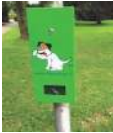
In de bak die kak.

Als wijkagent ontvang ik regelmatig klachten over hondenpoep. Het achterhalen van de dader en zijn baasje is vaak lastig of onmogelijk. Uit de resultaten van de enquête over leefbaarheid blijkt elk jaar weer hetzelfde: iedereen ergert zich aan hondenpoep. Het is smerig en het is gevaarlijk. Uit onderzoek is gebleken dat zich in bijna elke drol eitjes bevinden van parasieten zoals spoelwormen. Besmetting met spoelwormen kan groeistoornissen, huidirritaties, buikgriep, of lusteloosheid veroorzaken, en in ernstiger gevallen zelfs hart- en nierfalen.