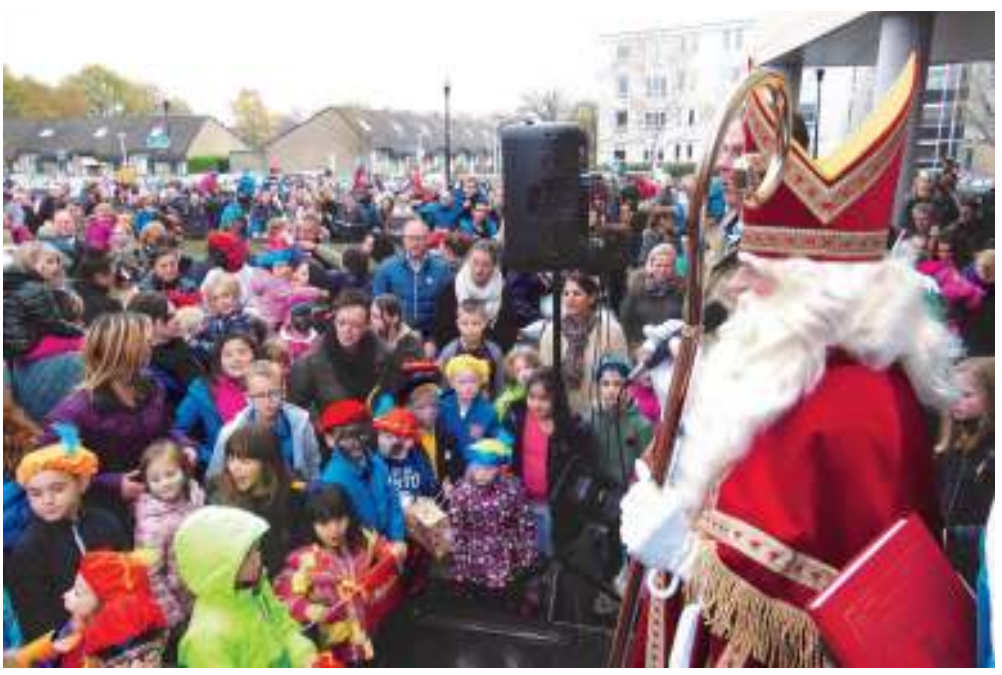
Vol verwachting en met kloppend hart begroette het in grote aantallen toegestroomde publiek Sinterklaas op zaterdag 14 november.

Het was een drukke dag voor de sint en zijn pieten op zaterdag 14 november. Om 12.00 uur aankomst in Meppel, daarna naar Hengelo voor de aankomst om 14.00 uur in de stad en daarna spoorwegs naar de Hasseler Es voor het warm onthaal om 14.30 uur. In afwachting van de goedheiligman werden enthousiast enkele sinterklaasliedjes gezongen onder leiding van dirigent Ron Wesseling, voorzitter van de wijkraad. Het was echt weer voor Sinterklaas. Koud, diepgrijs, maar gelukkig net droog. Veel kinderen hadden hun gezichtjes van zwarte vegen laten voorzien om enige solidariteit met de pieten te tonen. Om iets over half drie werd de cabrio met Sinterklaas gesignaleerd. Langzaam reed de luxueuze zwartepieten-zwarte cabrio (beschikbaar gesteld door de firma Mazda Kolenaar aan het Oosterveld) met de goedheiligman het grote plein op. Na een korte waardige wandeling beklom Sinterklaas vervolgens onder luid gejuich het grote podium en liet zich daar nog eens lekker als een warme douche bezingen door het massale publiek. De sint ontdekte een moeder die niet meezong onder het publiek. Zij mocht