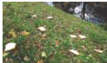
Hele boterhammen liggen op de oever van de Hesbeek bij de Robert Stolzstraat te wachten op ratten.

Helaas komt het regelmatig voor dat wijkbewoners grote zakken met stukjes brood en zelfs hele boterhammen bij de vijvers uitstrooien voor de (water)vogels. NIET MEER DOEN, WANT HET VOER TREKT RATTEN, MUIZEN EN ANDER ONGEDIERTE AAN. Ook komen extra veel eenden en meeuwen af op al dat voer en te veel watervogels veroorzaken vervuiling van het water