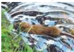
Een bruine rat in de Hesbeek bij de Robert Stolzstraat.

in de Buziauvijver en Hesbeek. De eendenpoep veroorzaakt een tekort aan zuurstof in het water. Daarom het dringende verzoek van gemeente Hengelo, het Waterschap Vechtstromen en de Wijkraad Hasseler Es: GEEN BROOD UITSTROOIE! De (water)vogels scharrelen hun eigen natuurlijke voedsel bij elkaar en hoeven beslist niet bijgevoerd te worden.