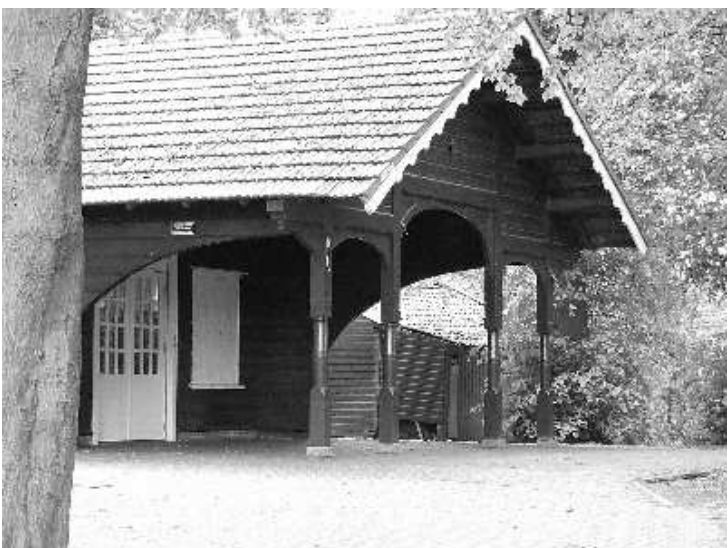
de jachthut aan het Bartelinkslaantje

Voor meer informatie zie www.wijkraadhasseleres.nl