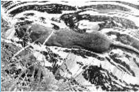
Een joekel van meer dan 50 cm incl. staart zwent in de Hesbeek bij de R.Stolzstraat .

In de afgelopen periode zijn er behoorlijk veel ratten (met jongen!) gesignaleerd in en langs de oevers van de Hesbeek. De meeste ratten zijn gezien bij de Hesbeek tussen de viaducten Oostelijke Esweg en Noordelijke Esweg. De komst van deze ziekteverspreidende dieren wordt veroorzaakt doordat er lekker veel voedsel aanwezig is. En dat komt weer doordat bewoners de eenden te veel brood voeren dat blijft liggen. Ratten komen daar onmiddellijk op af. Bewoners die de eenden regelmatig van voer voorzien worden daarom dringend verzocht het voeren te matigen en er op te letten