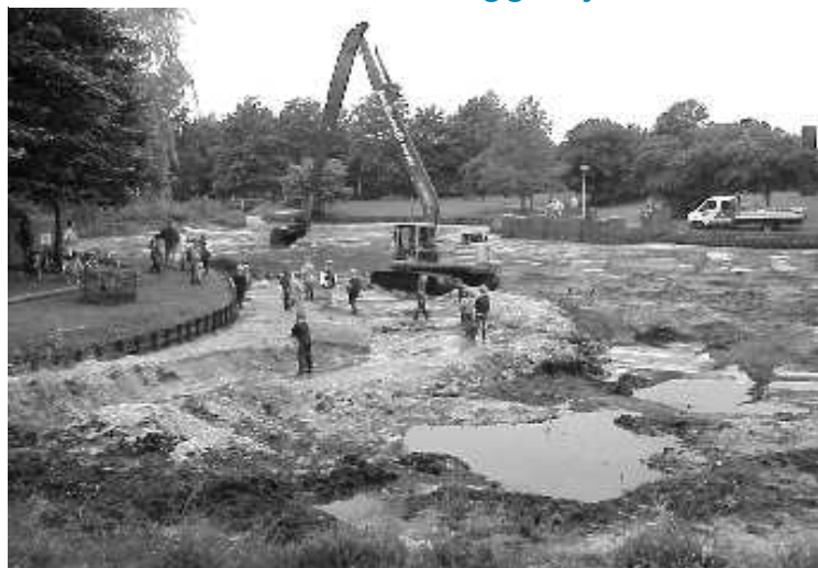
Baggerwerk bij de Buziau-vijver in 1999

Het Waterschap en de gemeente Hengelo hebben besloten de beken en aanliggende vijvers in de Hasseler Es weer te baggeren. De komende weken worden de voorbereidingen getroffen. Het werkelijke baggeren begint in week 27 en zal ongeveer 8 weken duren. De laatste keer dat er gebaggerd werd was in juni 1999, nu dus 8 jaar geleden.