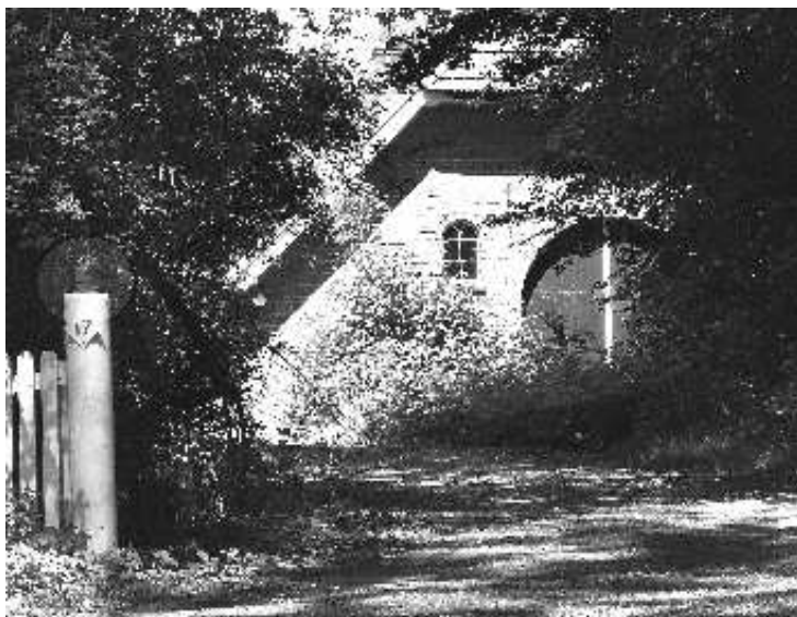
de schuur bij boerderij 't Leuvelt